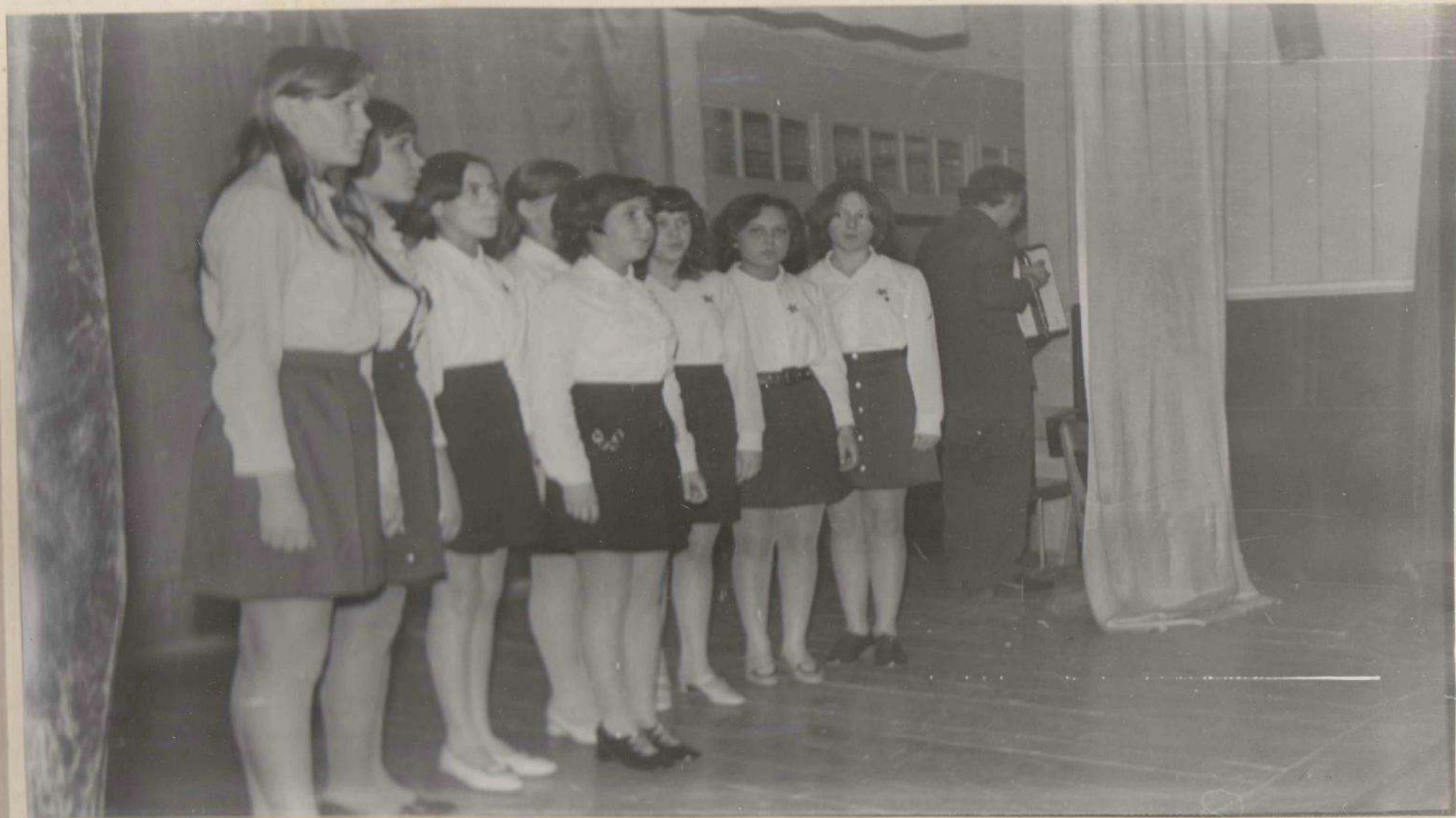
Ансамбль 4 "Г" курса.