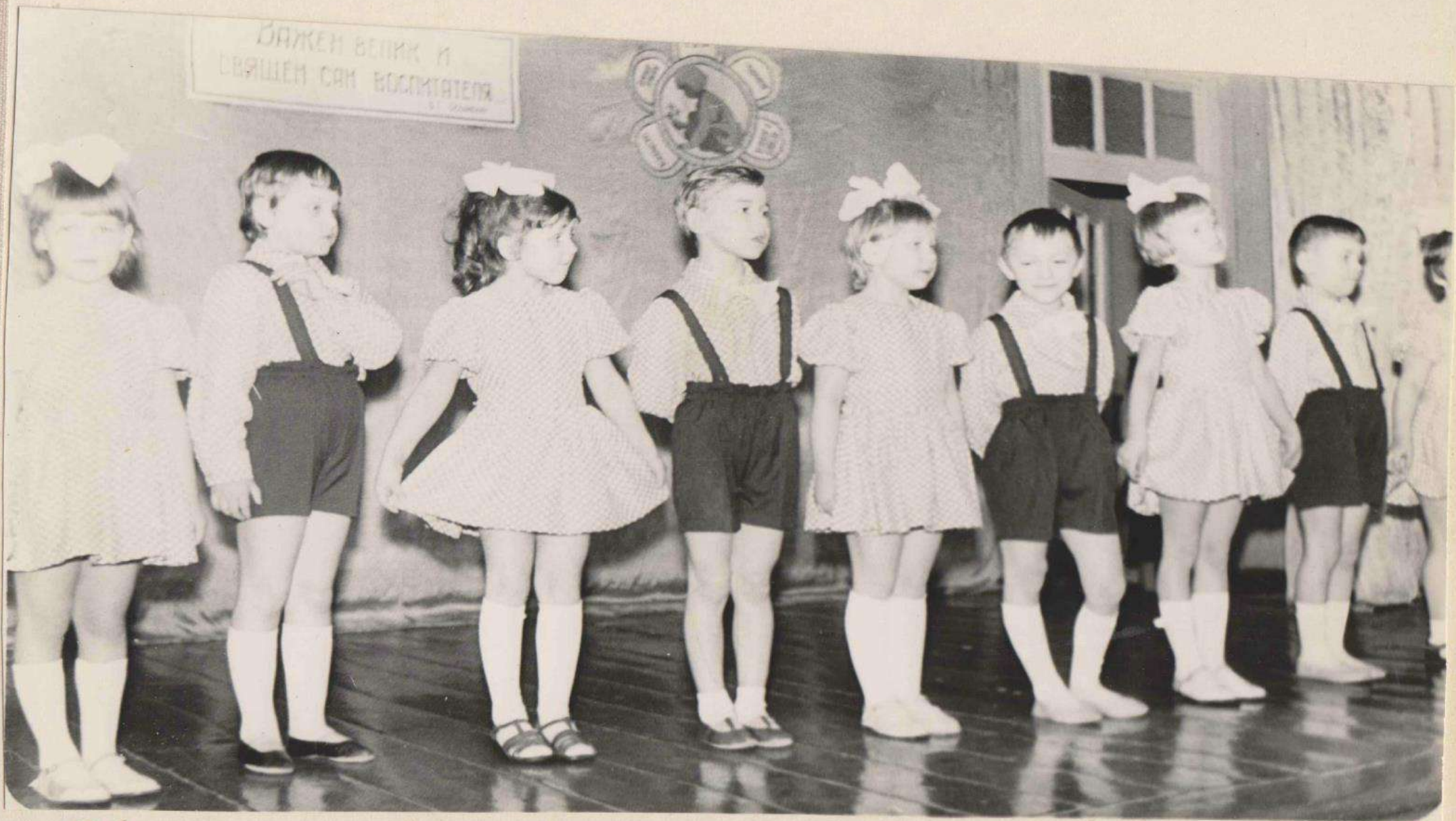
Частыми гостями в уголке бывают воспитанники д/сада „Малыш“.