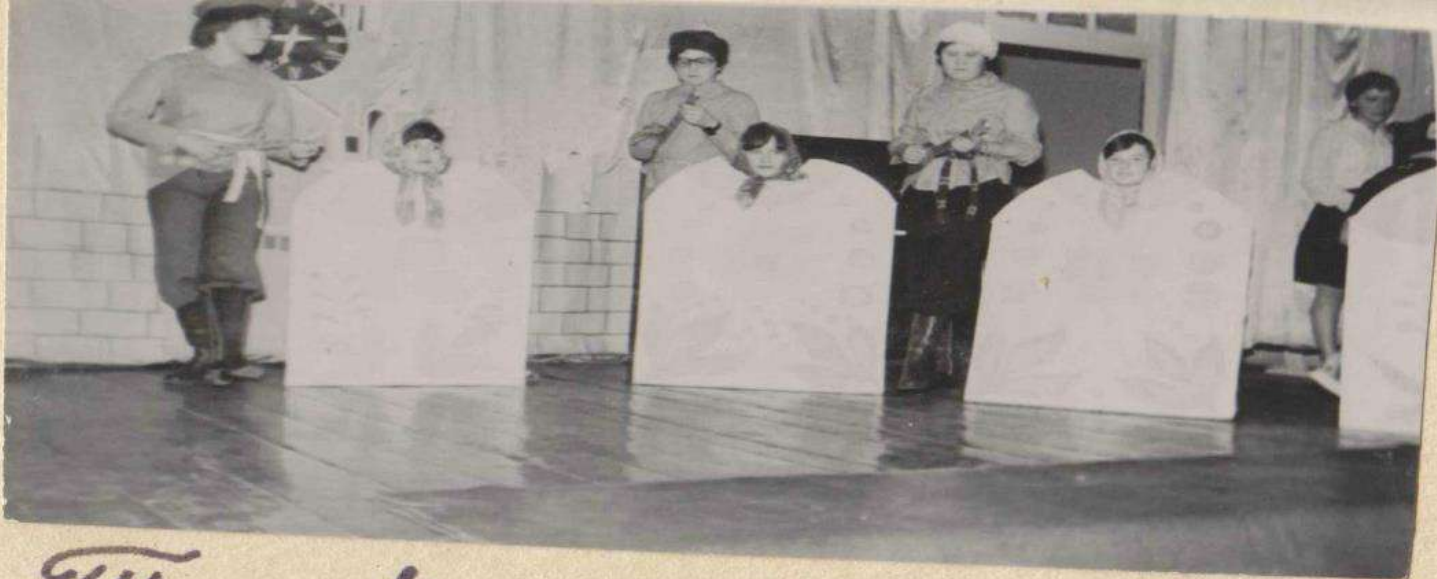
Танцевальная группа IV "Д"