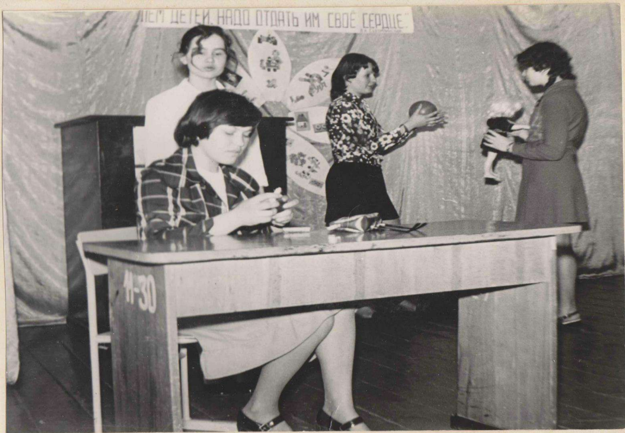
Конкурс „А ну-ка, девушки!“