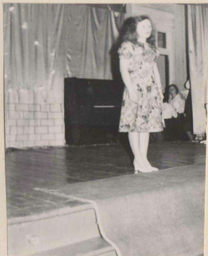
Слотр художественной самодетельности.