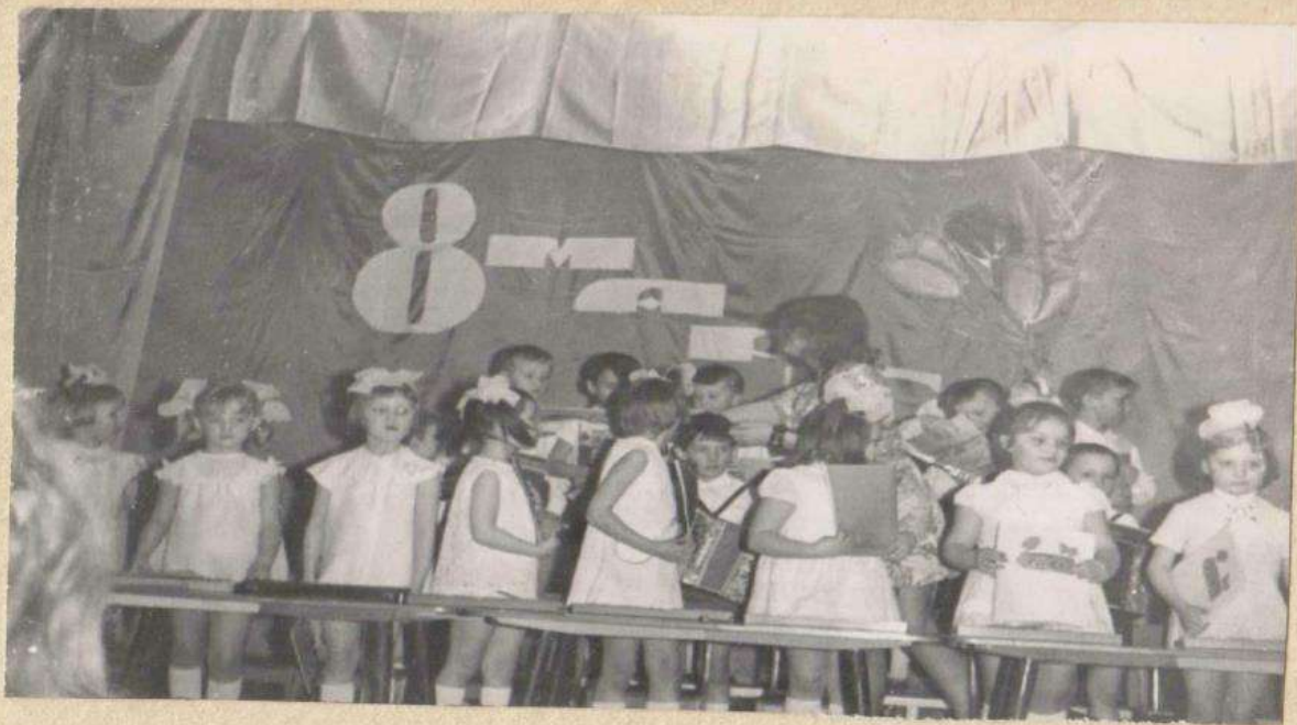
Воспитанники детского сада №12 на вечере, посвящённом Международному Женскому Дню 8 е Марта.