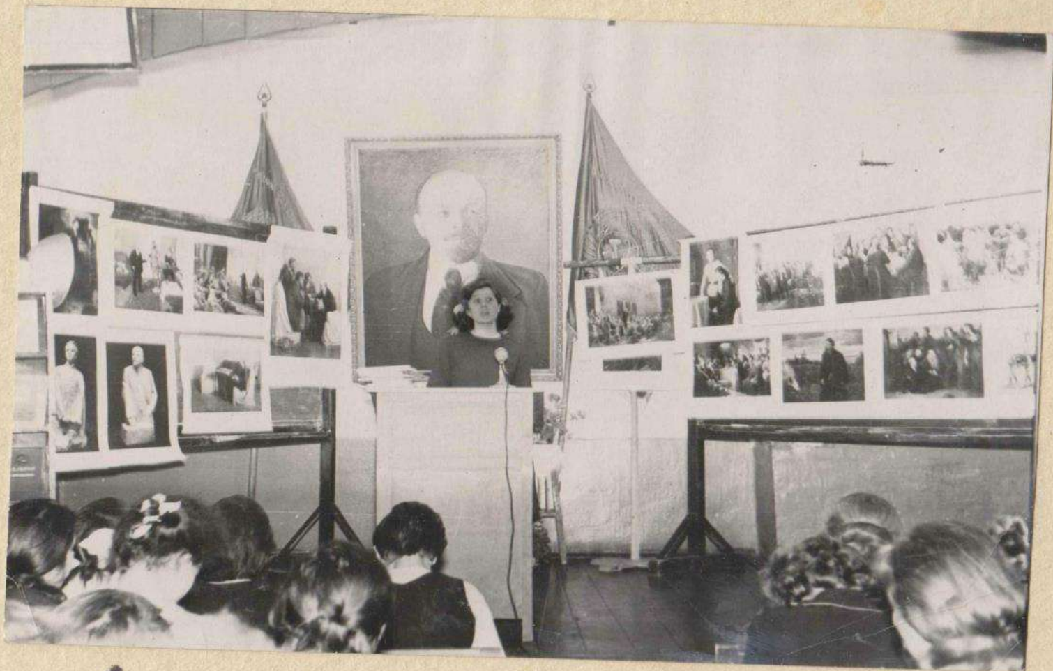
Ленинское чтение. „Образ В.И. Ленина в изобразительном искусстве“