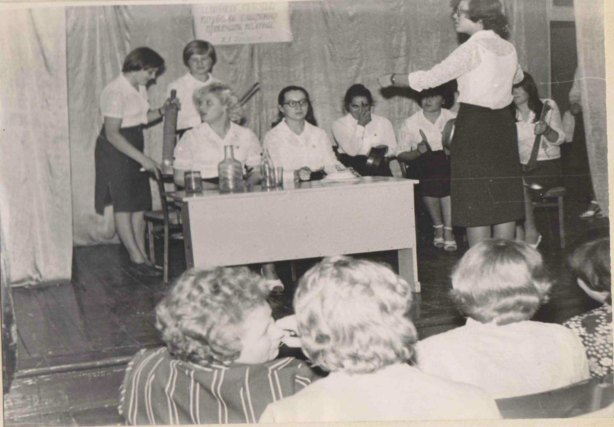
Выступает группа IV Б курса.