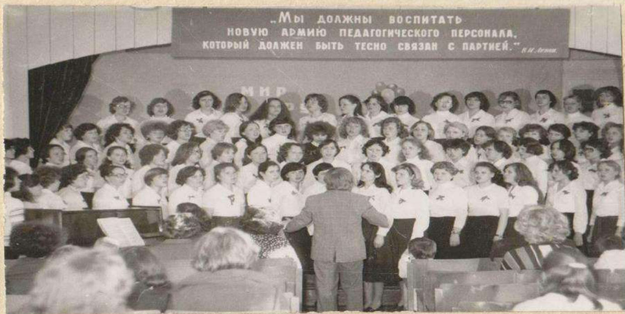
Май 1980 г. Хор школьного отделения.