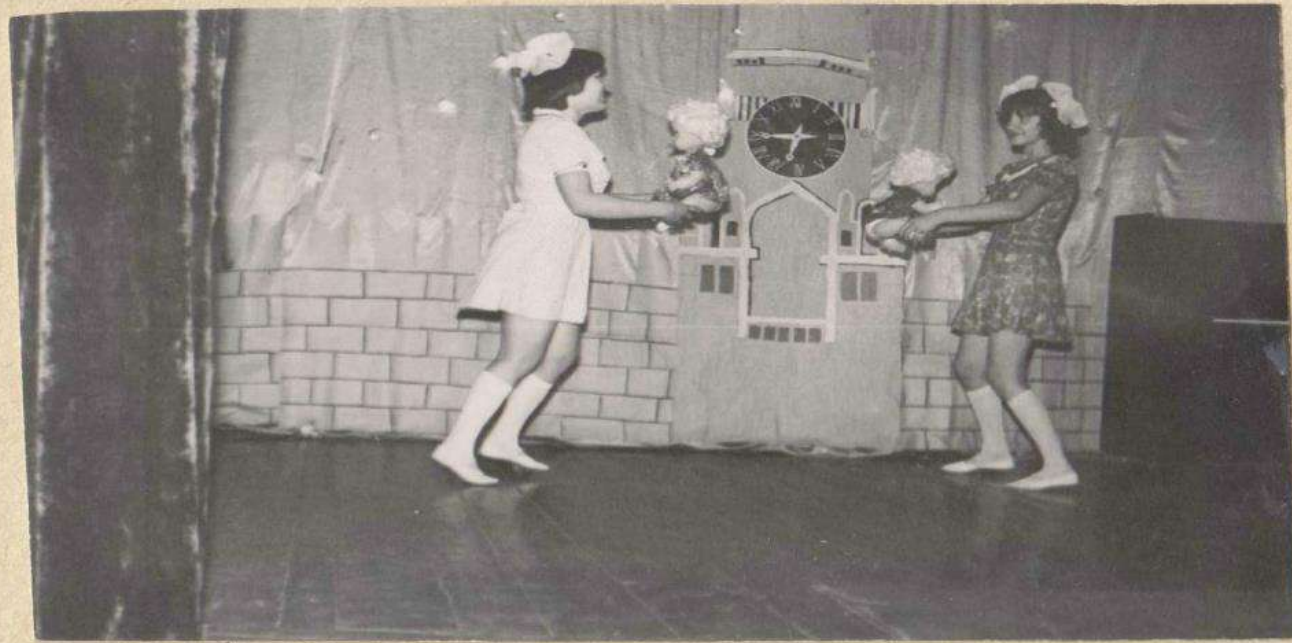
Танец с букетами.