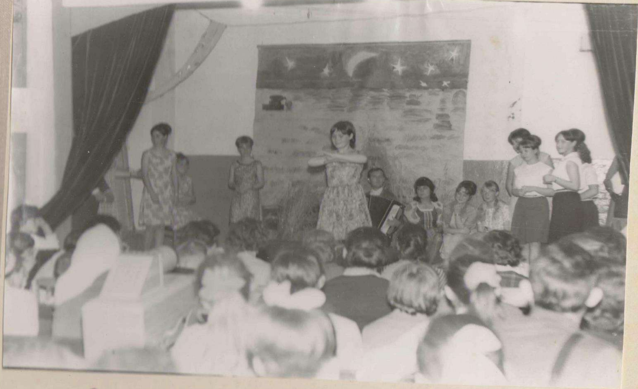
Смотр инсценированной песни.